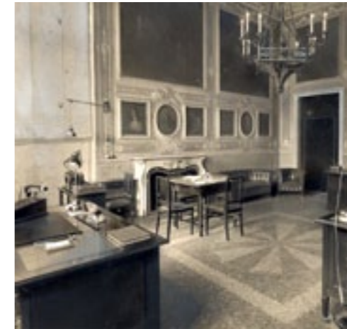
Sede storica di Via Garibaldi: uffici