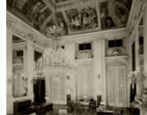
Sede storica di Via Garibaldi: il salone