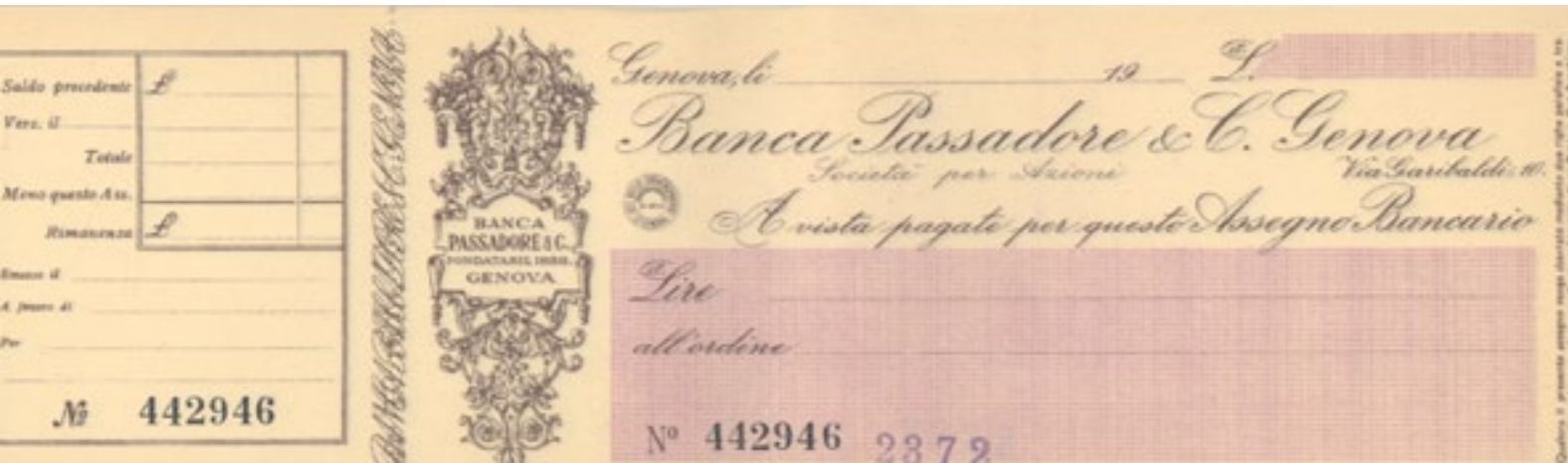
Assegno (anni '30)